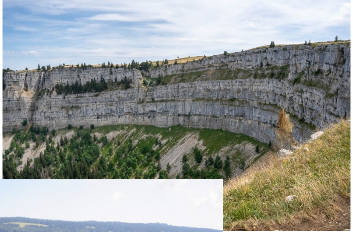
Creux du Van