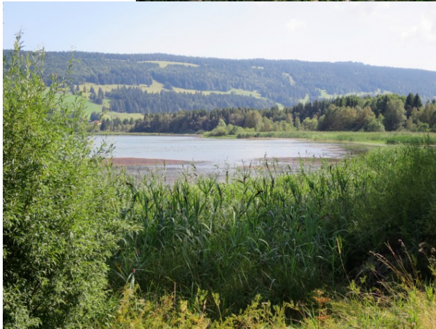
Lac du Joux