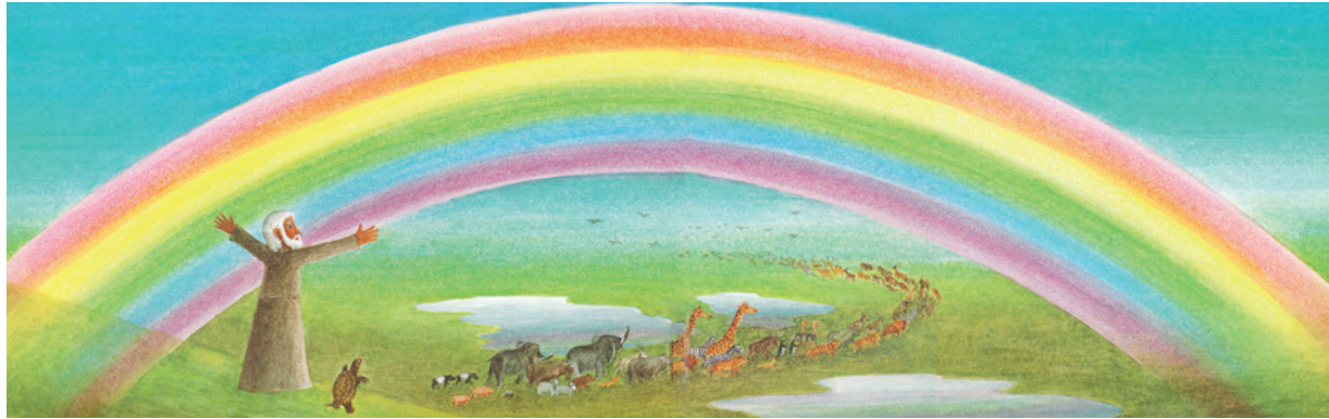
Aus «Die Arche Noah» von Kasyua Masahiro

könnte. Und wie bringt er die dann ans Wasser? Er hat doch gar kein Transportmittel für ein so grosses Schiff! Kaum ist die Arche fertiggestellt, nähern sich viele Tiere von allen Seiten. Was die so plötzlich wollen? – Finde es mit uns heraus und komm am Samstag, den 10. Juni zur nächsten Chinderfiir. Wie immer starten wir um 9.30 Uhr. Im Anschluss bist du und deine Begleitperson herzlich zum Chinderfiir Sirup & Kaffee im Kirchgemeindehaus eingeladen. Wir freuen uns auf dich und weitere Kinder im Alter von 3 bis 8 Jahren mit ihren Begleitpersonen.