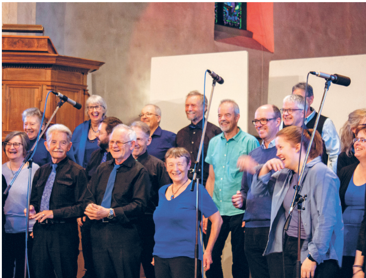
Haben Sie noch nie in einem Chor gesungen? – Dann ist das Gospelprojekt «My Hope» genau das Richtige.

Sonntag, 17. September, 9.45 Uhr, kath. Kirche