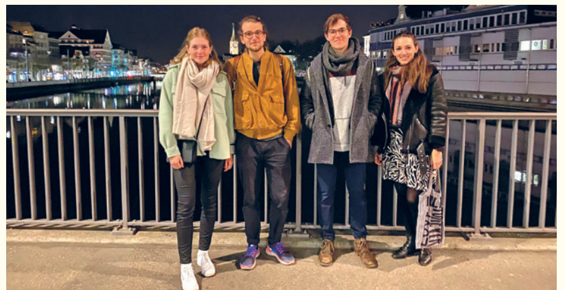
Pfäffiker Kleingruppe in Zürich