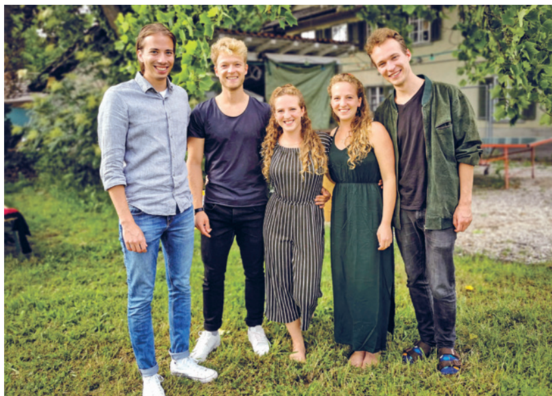
Vorstand Verein Njira

«Wir wollen Menschen in schwierigen Lebenssituationen unterstützen.»