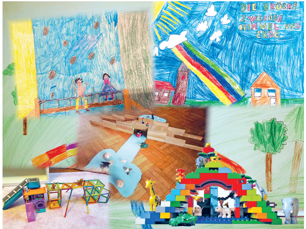
Mut zum Brückenbauen!